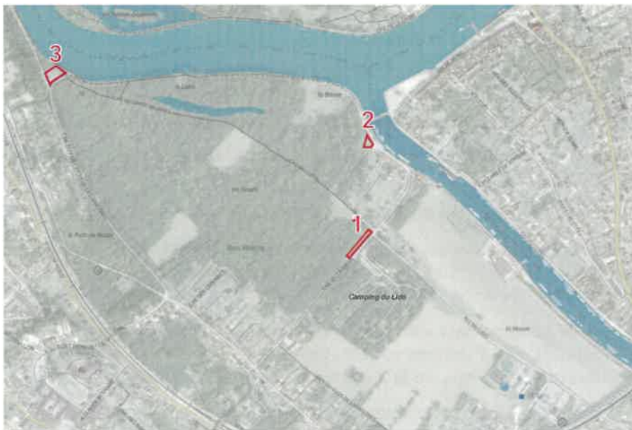
Figure 3 : Les différents scénarii de localisation de l'aire de stationnement

Lors des étapes de conception du projet, trois scénarii ont été envisagés et réfléchis conjointement par la maîtrise d'ouvrage et la maîtrise d'œuvre afin de définir l'emplacement de cette aire de stationnement, comme indiqué sur le plan ci-dessous :