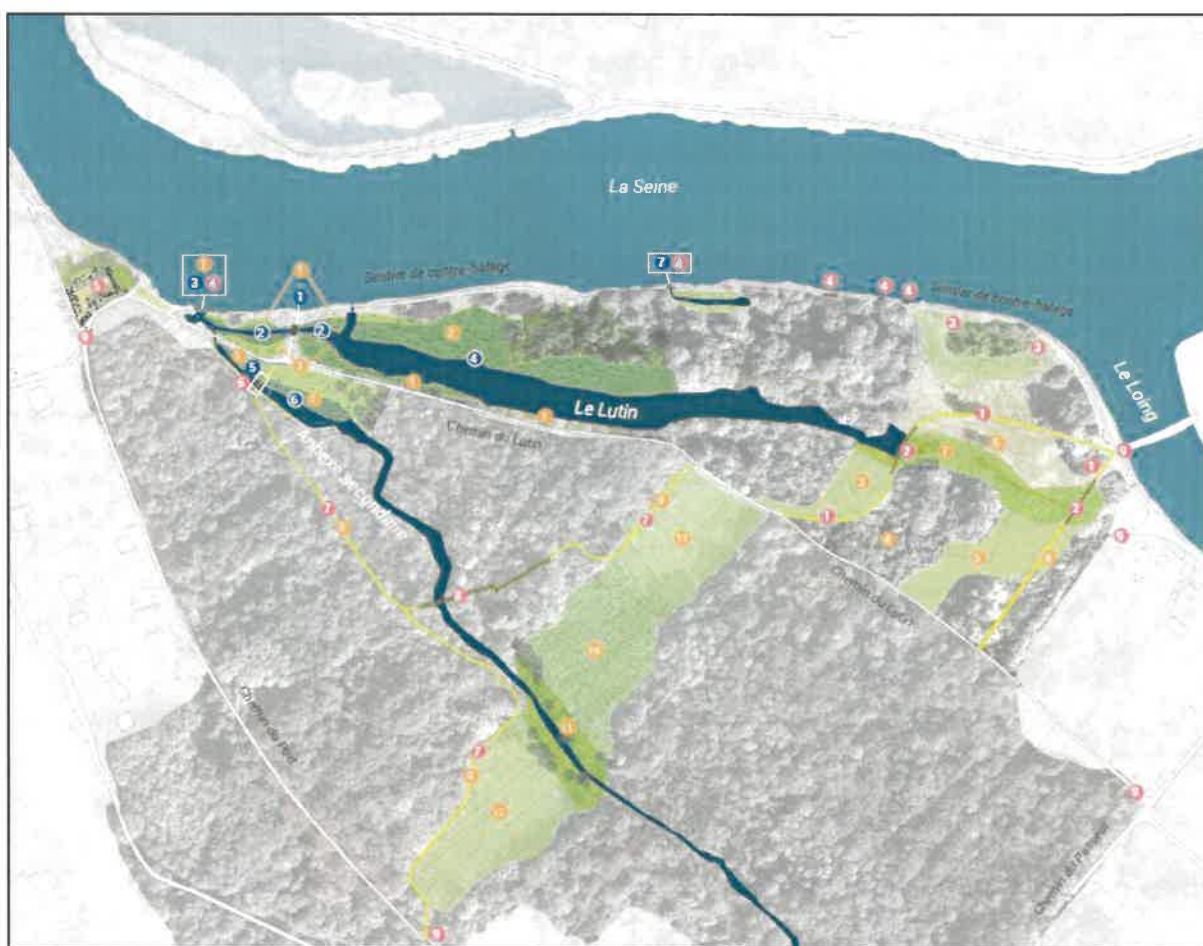
Figure 1 : Plan des aménagements – rapport PRO